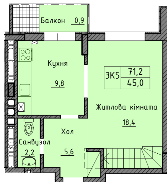
План квартири нижній рівень